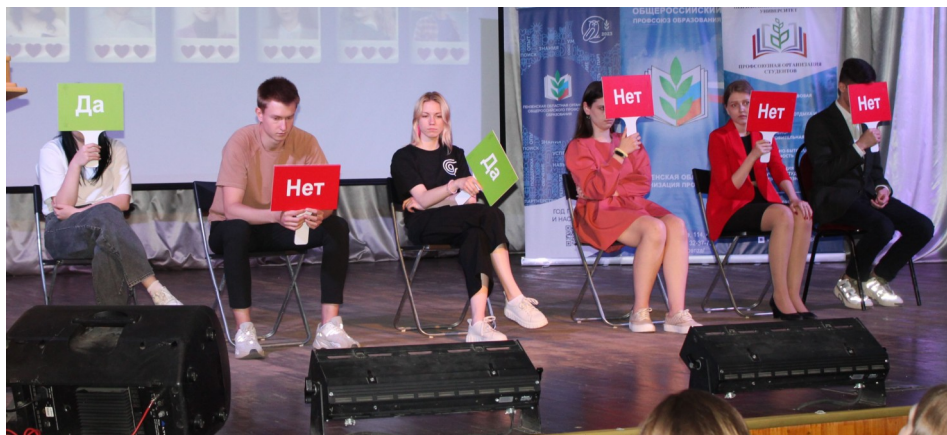
Конкурс «Два к одному»

того, было заметно, что активисты профкома легко ориентируются в самых разных сферах университетской жизни. Ведь какую бы точку зрения им не приходилось отстаивать, ребята доказывали свою правоту со знанием дела.