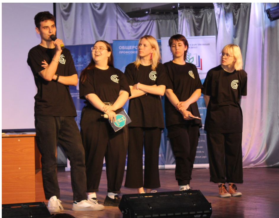
Команда профбюро Архитектурного факультета ПГУАС

боролись студенты трех вузов – ПГУАС, ПГУ и ПензГТУ.