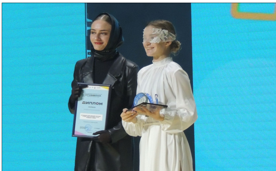
Руководитель и участница студии танца «EsTerra» принимают награды

Во время концерта стало понятно, что жюри отбирало не просто самые лучшие номера, но те выступления, которые могли удивить зрителей своей необычностью. Например, один из хореографических номеров был показан без музыкального